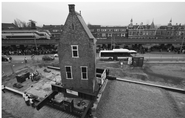
Bagijnetoren op zijn nieuwe fundering

De nieuwe fundering van beton was nodig om de toren in zijn geheel te kunnen verplaatsen.